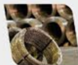
Fio de Aço CA60