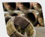
Fio de Aço CA60